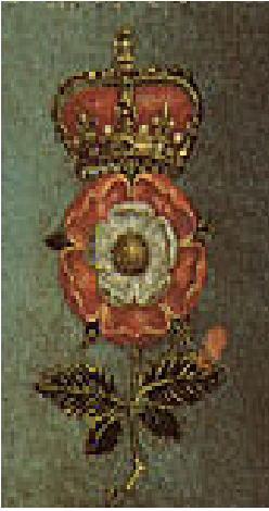
Bunga Mawar Tudor dari England.

Rahsia terbuka kesihatan optimum dan kesejahteraan kepada monarki British ketika Raja HENRY VII Tudor 1485. Baginda adalah satu-satunya anak Edmund Tudor dan Margaret Beaufort. Keluarga Tudors adalah salah satu keluarga England yang paling berkuasa – keluarga Lancaster. Pada waktu itu, Lancastrians sentiasa berperang dengan keluarga York atas tuntutan saingan. Baginda bernikah dengan Elizabeth dari York menyatukan dua rumah yang berperang, York dan Lancaster.